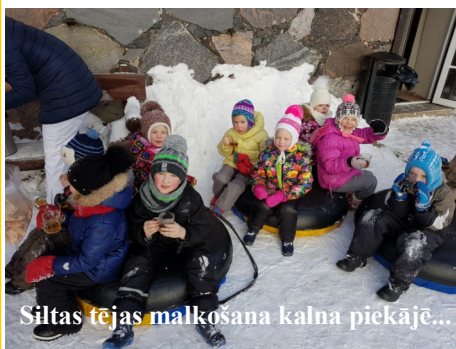
Siltas tējas malčkošana kalna piekāje...

Sargā sevi pats un Dievs Tevi sargās! Lai kā negribas aptumšot balto ziemas skaistumu un daili, bet tā ,diemžēl, nes sev līdzī arī tumšo pusi-slimošanu, vīrusus. Mēs neesam ģēnīgi, kuri varētu izvairīties no uzbrūkošajiem vīrusiem, bet mēs esam bērni, kuri varam tiem pretoties. Tāpēc apvienojām divas svarīgas lietas