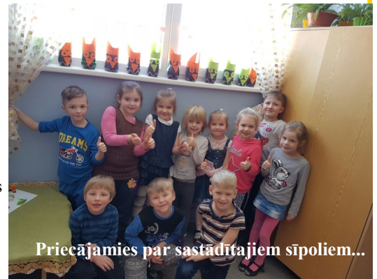
Priecājamies par sastādītajiem sīpoliem...

Ir iesācies jaunais ugunīgā gaiļa gads. Arī mūsu skolā ir 9 šīs zīmes pārstāvji: